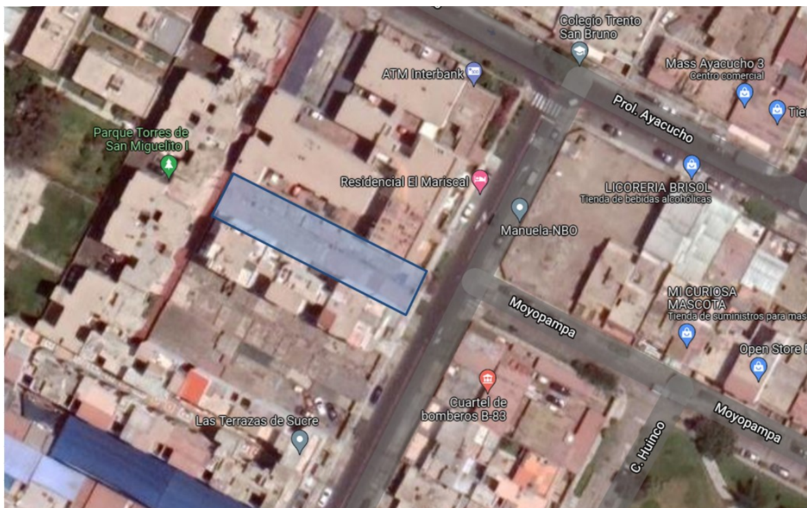
Plano de ubicación del terreno